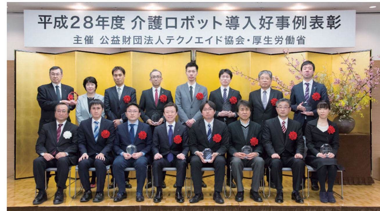
表彰式全体記念撮影

最優秀賞は、平成29年3月1日に行われました優秀賞案件8件の最終プレゼンテーション後、介護ロボット導入好事例表彰事業検討委員及び一般審査委員により、総合的に審査の上、決定されました。